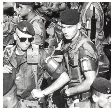
Französische Angehörige der Friedenstruppe, die als Teil der multinationalen schnellen Eingreiftruppe nach Bosnien entsandt wurden.