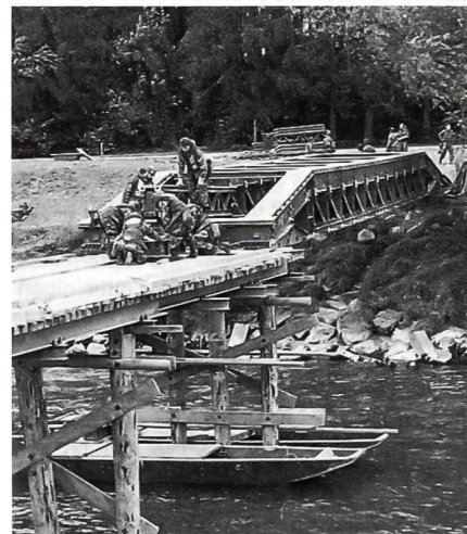
Rückzugsarbeiten an der «Kombi-Brücke» bei Amlikon. Pontons dienen als Arbeitsbühne.

chem die Kommandanten an ihre ungewohnte Aufgabe gingen. Eindrücklich waren auch Motivation und Einsatz der Truppe. Ich denke zB an die Grenadiere auf und um den Übungszug in Etzwilen; ich denke an die Füsilieri, die mir den Zutritt zu Bahnstationen verwehrten. Ich bin froh, dass ich der Übung «Scirocco» folgen durfte; sie hat mir altgedientem Soldaten neue Einsichten eröffnet.