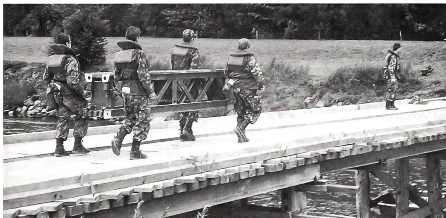
Bei Amlikon: Brückenbau ist harte Arbeit.

Auf dem Bahnhof Etzwillen orientierte der Kdt Füs Bat 68 über seinen Auftrag: Bewachen/Überwachen und Sichern von stationären Objekten von Etzwillen bis Ossingen exklusive, insgesamt deren 18. Eine Kp habe er in Etzwillen eingesetzt, eine im Zwischengelände bis Stammheim, eine in Stammheim selbst und eine im Zwischengelände bis Ossingen. In der Rekognoszierungsphase sei der Verbindungsaufnahme mit den Stationsvorständen grosse Bedeutung zukommen zur Abklärung folgender Fragen: Was ist für den