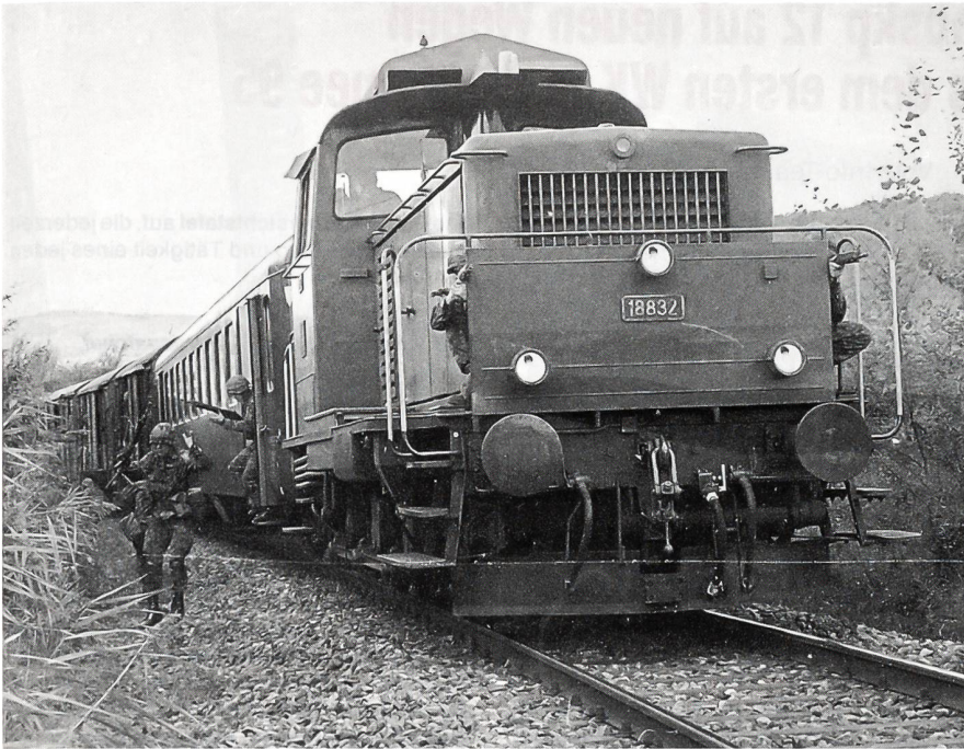
Blitzartig reagieren die Grenadiere beim Anhalten des «Übungszuges» in Etwilen.

Bahnbetrieb wichtig? Sind es die Stellwerke? Sind es die Trafostationen (ohne Strom fährt kein Zug)? Sind es Strassenüberführungen? Ist es zum Teil auch das Zwischengelände? Aus diesen Absprachen ergab sich die Zahl von 18 Aufträgen.