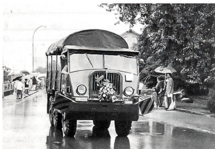
Der UOV Amt Hochdorf zeigte am Festumzug unter anderem einen restaurierten Saurer-Lastwagen 6x6 aus dem Jahre 1940.

Wer hätte wohl zu glauben gedacht, dass die Schweizer Armee in den letzten Jahren so viele verschiedene Fahrzeuge im Einsatz hatte? Die Älteren eher schon, aber die Jüngeren, die gerade noch den Pinzgauer oder den neuen Puch-Geländewagen kennen, eher nicht. Der Festumzug wurde unter dem Motto «Musik und Brauchtum» durchgeführt. Der Unteroffiziersverein Amt Hochdorf als ortsansässiger Verein liess sich die Gelegenheit nicht entgehen, um