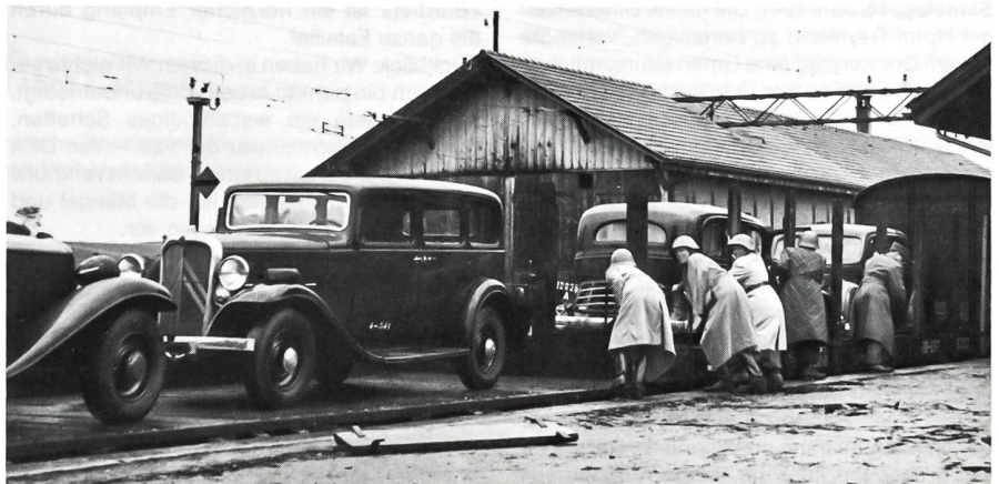
Am 13.6.41: Verladen der Pws