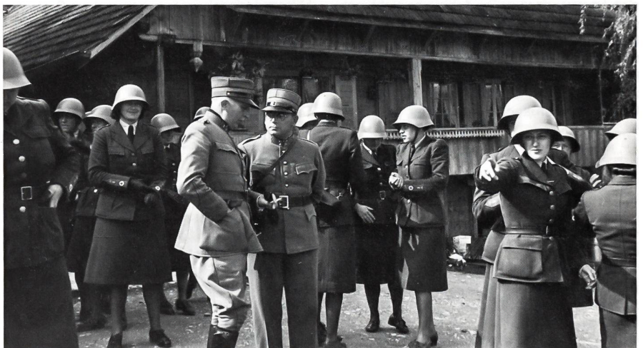
Am Entlassungstag am 14.6.41