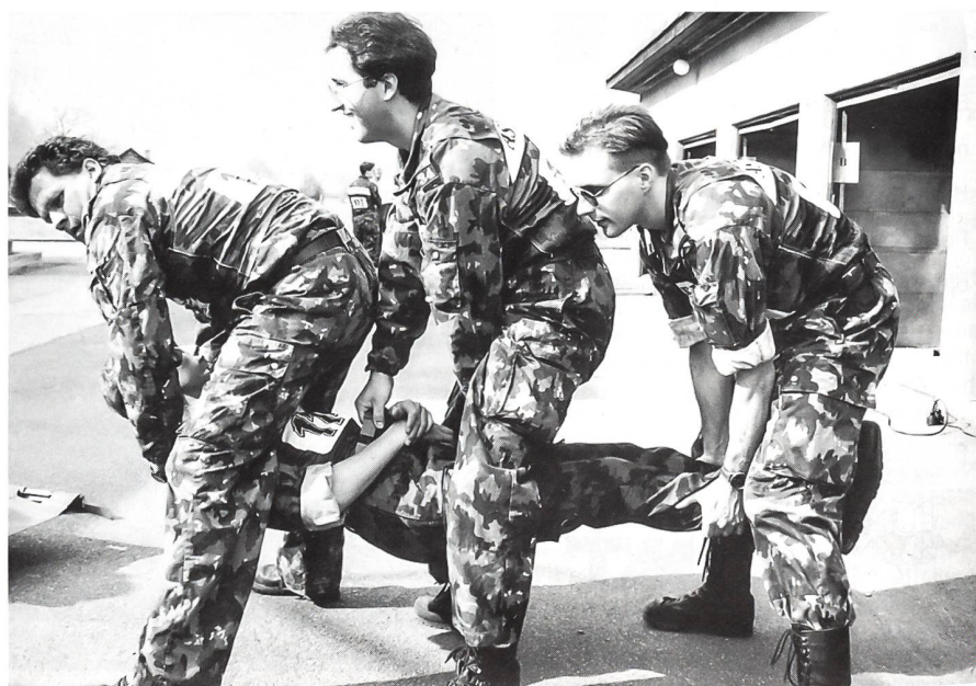
Heben und Umlagern im Brückengriff.