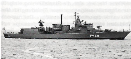
Die Fregatte «Adrias» kurz nach der Übernahme durch die griechische Flotte.

Griechenland – Im März erhielt die griechische Marine von den Niederlanden das dritte Schiff der Kortenaar-Klasse. Die Schiffe tragen die Namen F 459 «Adrias», F 460 «Aegeon» und F 461 «Navarinon» (siehe Schweizer Soldat+MFD Nr 4/94). Derweil