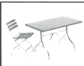
Einrichtungen für Spitäler und Pflegeheime

bemag sissach Basler Eisenmöbelfabrik AG