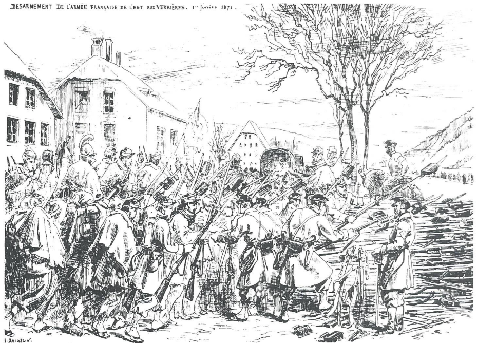
Entwaffnung der in die Schweiz übergetretenen Angehörigen der Bourbaki-Armee. A Bachelier aus Buch «100 Jahre CH-Armee» vom Ott-Verlag Thun

Im Frühsommer 1870 kandidiert Erbprinz Leopold von Hohenzollern-Sigmaringen als König von Spanien. Die französische Regierung sucht diese Thronbesteigung mit allen Mitteln zu verhindern. Der Vater des Erbprinzen will die Franzosen nicht unnötig erzürnen und veröffentlicht daher am 12. Juli im Namen seines Sohnes eine offizielle Verzichtserklärung. Damit wären eigentlich die Differenzen bereinigt. Der übereifrige französische Botschafter, Graf Benedetti, glaubt aber am darauffolgen-