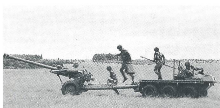
Light Gun mit Zugfahrzeug

beeindruckt es mit seiner Maximalschussweite von über 17 Kilometern. Auf einer runden Bodenplatte kann es volle 360 Grad geschwenkt werden und so rundum wirken. Im Kaliberbereich 155 mm erfüllt die amerikanische Feldhaubitze M198 die Anforderung der Luftverlastbarkeit: mit ihren gut 7 Tonnen Gewicht kann sie noch bedingt helitransportiert werden. Sie befördert die verschiedensten Geschosse bis zu 30 Kilometer weit. Die mehr als 2 Tonnen schwerere deutsche Feldhaubitze FH-70 ist ein ähnlich gebautes Geschütz mit ähnlichen Leistungsdaten. Sie ist in