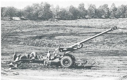
Feldhaubitze FH 70

Dass unsere beiden noch im Dienst stehenden gezogenen Geschütze 10,5-cm-Kanone 35 und die 10,5-cm-Haubitze 46 nicht mehr das Neueste auf dem Markt sind, ist bekannt. Nichtsdestotrotz sind sie aber mit einer motivierten, gut ausgebildeten Geschützbedienung noch sehr leistungsfähig und wirkungsvoll. In der Armee 95 wird unsere 10,5-cm-Kan, bald 60 Jahre alt, keinen Platz mehr finden. Die leistungsgesteigerte 10,5-cm-Hb wird weiterhin im Geb AK 3 verwendet. Das britische Leichtgeschütz 105 mm Light Gun, das geringfügig abgeändert in den USA als M119 eingeführt wurde, erfüllt die Bedingung der Lufttransportfähigkeit optimal. Ausserdem