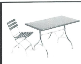
Einrichtungen für Spitäler und Pflegeheime

bemag sissach Basler Eisenmöbelfabrik AG