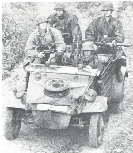
Herbst 1941 – VW-motorisierter Spähtrupp der Waffen-SS im Osten.

Schweizer kamen auf praktisch allen europäischen Kriegsschauplätzen zum Einsatz. Insbesondere im Osten, von der Krim bis Karelien, während der zweiten Schlacht um Frankreich 1944, an der Cassinofront, auf dem Balkan, im Frühjahr 1945 an Oder und Rhein und im Endkampf um Berlin... Zahlreiche Schweizer Freiwillige wurden mit Tapferkeitsauszeichnungen dekoriert, führten deutsche und ausländische Kompanien und Bataillone. Der ehemalige Kommandant eines Schweizer Grenzbataillons stieg sogar, mit dem Eisernen Kreuz 1. Klasse ausgezeichnet, auf dem Weg in die Generalsränge zum SS-Oberführer auf. Nach der Kapitulation befanden sich die Schweizer über halb Europa verstreut und von den USA über Ägypten bis nach Sibirien, teils unter miesesten Bedingungen gehalten, zumeist in alliierten Gefangenenlagern. Der erpresste Eintritt in die französische Fremdenlegion wurde hie und da geradezu als Erlösung empfunden. Das 1948 aufgestellte 1. Bataillon Etranger de Parachutistes beispielsweise rekrutierte sich fast ausschliesslich aus Kriegsgefangenen. Eine Liste des SS-Hauptamtes von Mitte Januar 1945 weist 89 gefallene, verstorbene und