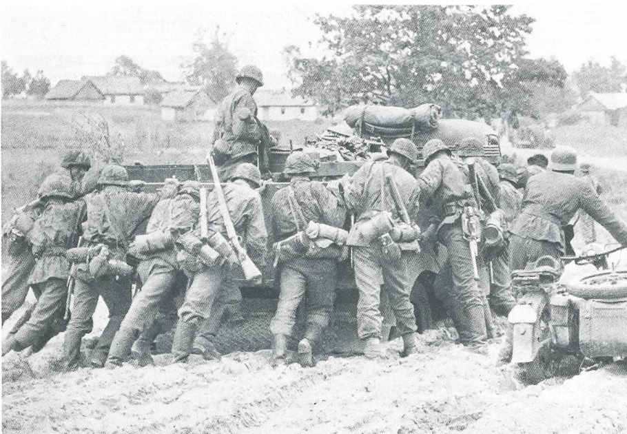
SS-Infanterie 1941 – Russische Landstrassen haben's in sich.

Da die Präsenz von Schweizern an der Ostfront deutscherseits auch einer gewissen propagandistischen Bedeutung nicht entbehrte, kamen die Freiwilligen in der Folge dezentralisierter zum Einsatz. Man konnte es sich nicht leisten, Schweizerkompanien in einem einzigen russischen Kriegswinter zu