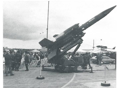
Flab-Lenkwaaffe «Bloodhound» BL 64