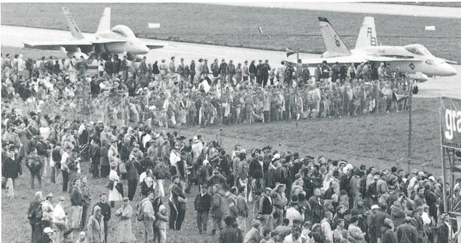
Die F/A-18-Flugzeuge der US Navy stiessen beim Publikum auf sehr grosses Interesse.

pen ausgestellt und vorgeführt. Erstmals konnte sogar ein Kriegs-Flugzeugunterstand besichtigt werden. Auf grosses Interesse stiessen die beiden F/A-18-Kampfflugzeuge der US-Navy, deren Teilnahme kurzfristig zugesagt wurde. Zahlreiche hochrangige Politiker, Behördenvertreter und Repräsentanten der Armee waren beim offiziellen Festakt kurz vor dem Mittag im Festzelt vertreten. Der Nachmittag gehörte den Flugvorführungen unserer Flugwaffe. Das ganze Einsatzspektrum der einzelnen Flugzeugtypen und