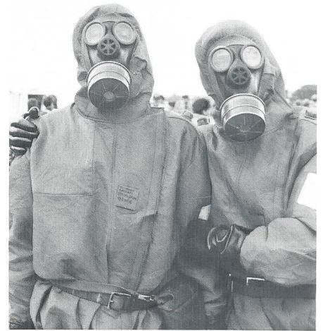
Die Soldaten waren sogar im Cesar-Schutzanzug gut gelant.

Die dunkelblauen Truppen werden diese Herausforderung annehmen und meistern.