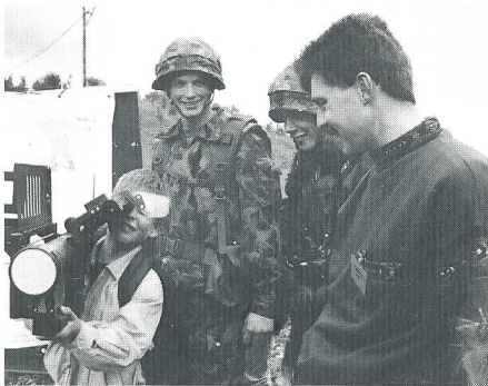
Die umfangreiche Waffen- und Geräteausstellung war zum Anfassen. So auch hier mit dem Leichten Fliegerabwehr-Lenkwaffen-System «Stinger».

Das Wetter war nicht gerade einladend, trotzdem folgten aber gegen 50 000 Besucher dem Jubiläum der dunkelblauen Truppen. Der Vormittag stand im Zeichen des Kame- radentreffens und der statischen Schau. Dort wurden alle Geräte und Waffen der FF-Trup-