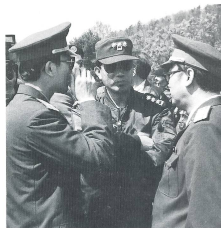
Gäste und Beobachter waren auch die Militärattachés verschiedener Staaten.

Nachdem die fiktiven Überflugsbewilligungen von Österreich und Tschechien erteilt waren, traf am Freitag, spät in der Nacht, aus Kloten eine kleine Rekognoszierungs-Mannschaft, bestehend aus Suchhunden mit ihren Führern, Spezialisten und Arzt, am Übungsplatz in Wangen a/A ein. Am Samstag wurden weitere aufgebotene Rettungsmannschaften ins «Trümmendorf» gebracht. Diese waren alle mit Verpflegung für 3 Tage und Zelten zum Schlafen ausgerüstet. An den beiden für Brunn simulierten Schadenplätzen in Wangen an der Aare und Grenchen waren gegen 100 Personen mit ca 20 Hunden und 15 Tonnen Material im Rettungseinsatz. In Wangen a/A wurde nach dem Anflug mit Helikoptern die Rettung von Menschen (Hundeführer) geübt, während in Grenchen eine Trinkwasserfassung und Notbehausungen erstellt wurden. Die Suche mit den Hunden nach Verschütteten und das Ausgraben durch Spezialisten wurde eindrucksvoll demonstriert. Wenn man bedenkt, dass im Ernstfall noch gegen den Leichengeruch angekämpft werden muss, kann man diese Retter nur bewundern. Auch die Arbeit der Strahlenfachmänner auf mögliche Quellen radioaktiver Belastung ist von grosser Bedeutung.