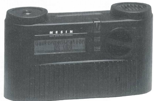
Gasmessgerät Typ 3500

Beim neuentwickelten, tragbaren MESIN Gasmessgerät wurde grossen Wert auf ein funktionelles Design, einfache Bedienung und Sicherheit in der Handhabung des Gerätes gelegt.