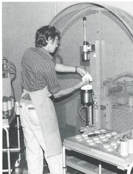
Die Angehörigen der Belegschaft gelten auf dem Gebiet der Munitions- und Sprengstoffverarbeitung als qualifizierte Fachkräfte.

Die Anlage wird mithelfen, diese speziellen Arbeitsplätze zu erhalten, denn eine Fertigung von Produkten wie Panzerfaust, Pulverladungen und Beleuchtungsmunition, aber auch das Delaborieren von obsoletter Munition wäre in der heutigen Zeit in den alten Gebäuden des Feuerwerkers nicht mehr denkbar. Die dritte und letzte Etappe ist Ende 1993 dem Betrieb übergeben worden. In den Jahren 1990 und 91 wurden die beiden ersten Bauetappen sukzessive in Betrieb genommen. Die ersten Betriebsjahre zeigen, dass unter bestmöglichen Sicherheitsbedingungen eine wirtschaftliche Fertigung möglich ist und man damit von einem gelungenen Bauwerk sprechen kann. Wir sind überzeugt, dass wir heute ein auf die Zukunft ausgerichtetes, zweckmässiges Bauwerk einweihen, an einem für die Sprengstoffverarbeitung idealen Standort, abseits von Agglomerationen und Hauptverkehrsachsen.