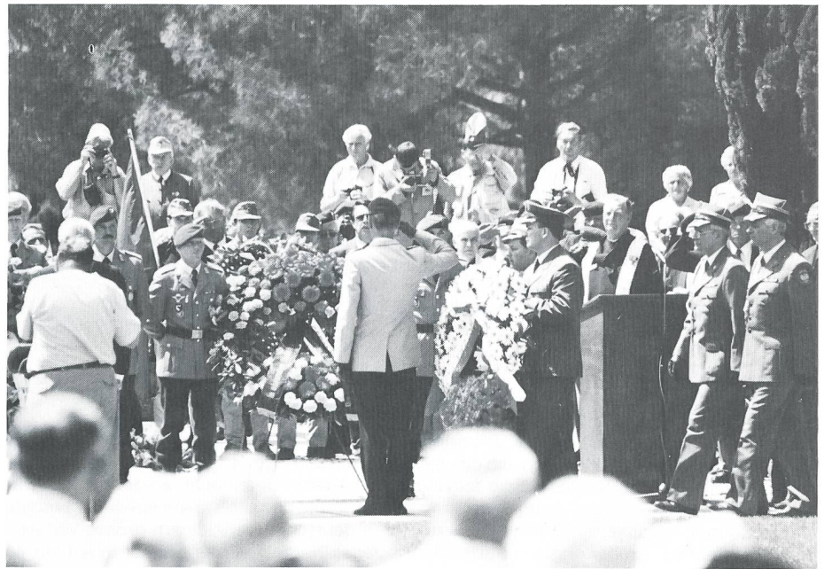
Deutsche Gedenkfeier mit englischem Feldprediger und polnischer Delegation.

Viele Hunderte von Veteranen waren aus der ganzen Welt angereist, um der Toten zu gedenken. Die blauen Turbane der Inder waren an der offiziellen deutschen Gedenkfeier zu sehen, ehemalige deutsche Fallschirm- und Hochgebirgsjäger nahmen an der Commonwealth-Feier teil. Am Dienstag war der französische Tag, am Mittwoch der polnische. Ein weiterer Tag war offiziell für alle gemeinsam gedacht, und gegen Ende der Woche feierten die Amerikaner auf ihre Weise, immer alle mit den ehemaligen Gegnern und Verbündeten, mit denen sich aus dem gemeinsam Erlebten trotz Sprachschwierigkeiten rasch herzliche Gespräche ergaben. 50 Jahre nach der grössten Völkerschlacht des 2. Weltkriegs, an der auf alliierter Seite 26 Nationen teilgenommen haben sollen, Deutsche, Österreicher, Amerikaner, Engländer, Neuseeländer, Inder, Franzosen, Marokkaner, Algerier, Tunesier und viele andere. Eindrücklich ist diesbezüglich neben dem britischen auch der französische Friedhof in Ve-