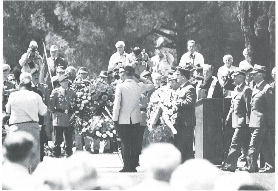
Deutsche Gedenkfeier mit englischem Feldprediger und polnischer Delegation.

Viele Hunderte von Veteranen waren aus der ganzen Welt angereist, um der Toten zu gedenken. Die blauen Turbane der Inder waren an der offiziellen deutschen Gedenkfeier zu sehen, ehemalige deutsche Fallschirm- und Hochgebirgsjäger nahmen an der Commonwealth-Feier teil. Am Dienstag war der französische Tag, am Mittwoch der polnische. Ein weiterer Tag war offiziell für alle gemeinsam gedacht, und gegen Ende der Woche feierten die Amerikaner auf ihre Weise, immer alle mit den ehemaligen Gegnern und Verbündeten, mit denen sich aus dem gemeinsam Erlebten trotz Sprachschwierigkeiten rasch herzliche Gespräche ergaben. 50 Jahre nach der grössten Völkerschlacht des 2. Weltkriegs, an der auf alliierter Seite 26 Nationen teilgenommen haben sollen, Deutsche, Österreicher, Amerikaner, Engländer, Neuseeländer, Inder, Franzosen, Marokkaner, Algerier, Tunesier und viele andere. Eindrücklich ist diesbezüglich neben dem britischen auch der französische Friedhof in Ve-