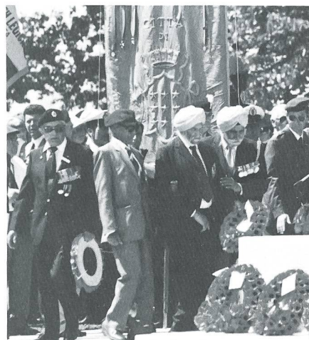
Angehörige der 4. Indischen Division an der Commonwealth-Feier.

Trotzdem fühlte sich der 79-jährige Abt des Klosters sicher, nicht nur wegen der meterdicken Mauern, sondern auch weil er sich nicht vorstellen konnte, dass der Krieg so grausam und primitiv sein konnte, auch sein Kloster mit den unschätzbaren Kulturgütern zu erfassen. In der Tat blieb das Kloster vor-