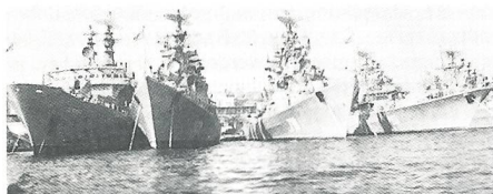
Zerstörer und Schlachtschiffe der Schwarzmeerflotte der GUS am Marinestützpunkt Sewastopol.

Offiziell geht es heute in erster Linie um die Schwarzmeerflotte und ihre Stützpunkte. Darüber wird schon lange auch auf höchster Ebene verhandelt, und das Ende dieser Verhandlungen und deren Ergebnis sind nicht absehbar, aber praktisch wäre das Problem lösbar. Schlimmer steht es mit der Zugehörigkeit der Krim bzw ihrem Verhältnis zur Ukraine und zu Russland.