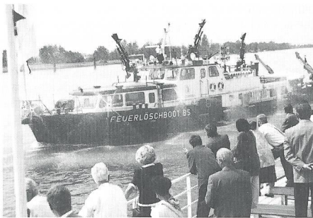
Am späteren Nachmittag demonstrierte das Basler Feuerlöschboot «Christophorus» sein Können auf dem Rhein.

ren beispielsweise Massnahmen gegen Missbräuche im Ausländerrecht ebenso wie Vorschriften gegen den Drogenhandel, das organisierte Verbrechen und den Waffenmissbrauch.