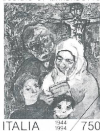
ITALIA 1944 1994 750