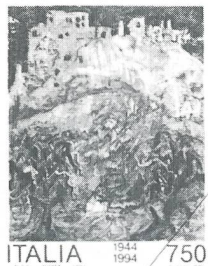
ITALIA 1944 1994 750