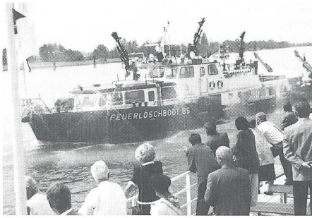
Am späteren Nachmittag demonstrierte das Basler Feuerlöschboot «Christophorus» sein Können auf dem Rhein.

ren beispielsweise Massnahmen gegen Missbräuche im Ausländerrecht ebenso wie Vorschriften gegen den Drogenhandel, das organisierte Verbrechen und den Waffenmissbrauch.