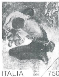
ITALIA 1944 1994 750