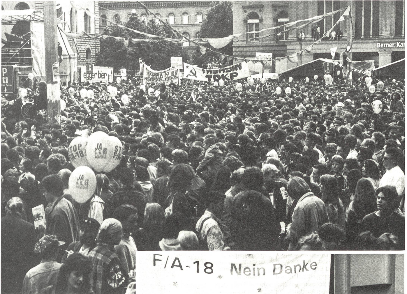
Hammer und Sichel über dem Bundesplatz in Bern; die Gruppe Schweiz ohne Armee (GSoA) macht's möglich!

Von der «Aktion Freiheit und Verantwortung», Zürich