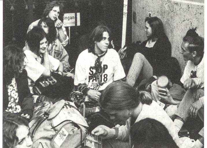
Gruppengespräch am Festival