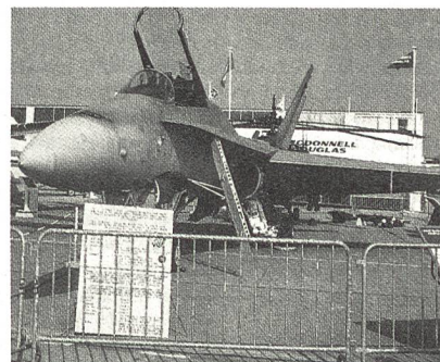
McDonnell Douglas F/A-18 A/C/D Hornet (bordgestütztes Mehrzweckkampfflugzeug, Mach 1.8 + auf 12 150 Meter Höhe, 20-mm-Revolverkanone, 7711 kg Aussenlasten, US Navy, US Marine Corps, Kanada) (auf dem Bild CF-18 Kanada).

Im Buch wird für den Fall Schweiz weniger von Bedrohungen gesprochen als mögliche zukünftige Entwicklungen anhand von Szenarien auf-