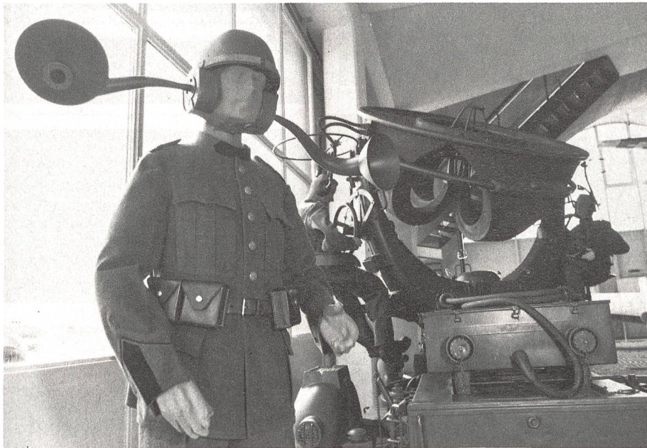
Horchposten mit «verlängerten Ohren». Solche Hörrohre wurden Ende der dreissiger Jahre versuchsweise eingesetzt. Im Hintergrund ein Siemens-Horchgerät «Elascop» aus dem Jahre 1936.

Beginn einer langen Evolution, die auch heute noch nicht abgeschlossen ist. 1946 begannen in der Schweiz auch die ersten Arbeiten an Lenkwaffensystemen, damals eine eigentliche Pionierleistung; das allererste Exemplar einer solchen Rakete ist im Originalstartgestell zu bewundern. Heute und in Zukunft stellt die Bedrohung durch Roboter die Flab vor neue, anspruchsvolle Aufgaben, was durch die ausgestellte echte «Cruise Missile» vor Augen geführt wird.