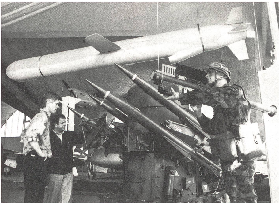
Moderne Flab-Lenkwaaffe «Stinger» und «Rapier» der Schweizer Armee. Oben im Bild eine Cruise Missile «Tomahawk», wie sie von der US Navy im Golfkonflikt eingesetzt wurde.