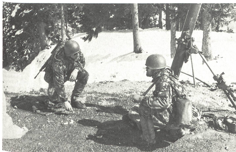
Minenwerferkanoniere der Sch Mw Kp 16 beim kombinierten Schiessen auf dem Glaubenberg.

Am Beobachtungsstandort arbeiteten jeweils der Kommandant eines Füs Bat mit einem Teil des Stabes und die Kompaniekommandanten. Dem Bat Kdt der Infanterie standen verschiedene Unterstützungswaffen zur Verfügung. Je nach Art und Stärke eines Gegners und dessen verschiedenem Vorgehen forderten die ihm unterstellten Kompanien Feuerbe-