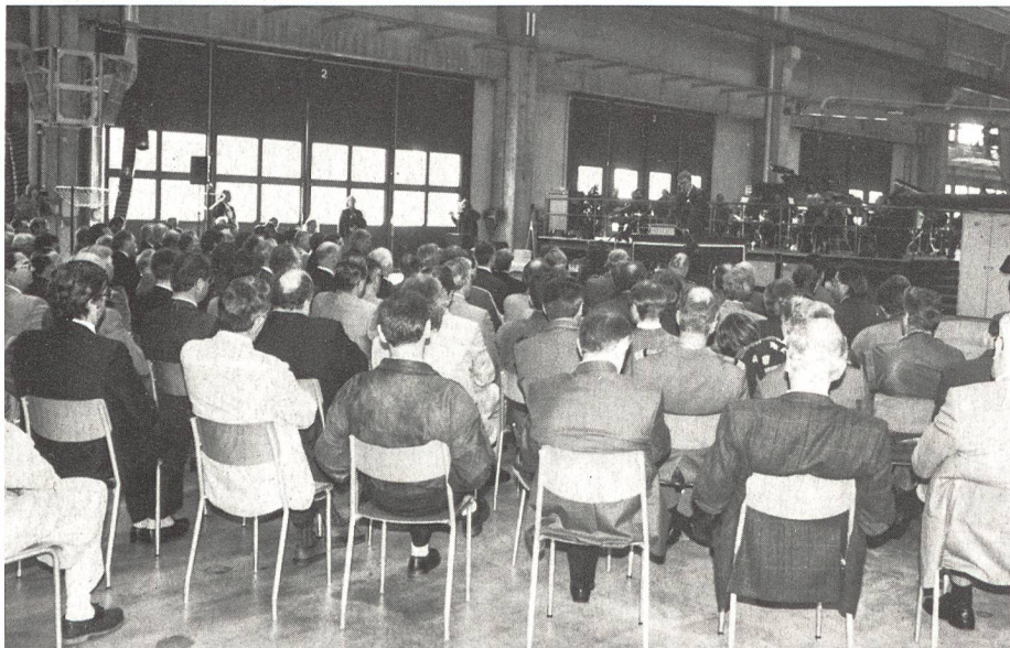
Nahezu 200 Gäste aus Wirtschaft und Armee nahmen an dieser Feier teil.