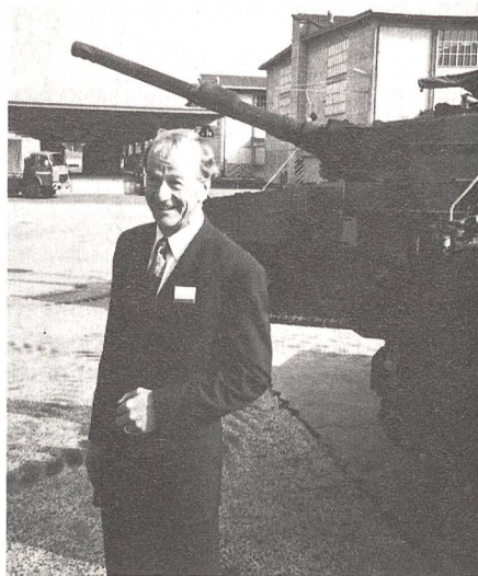
Dr. Hans Widmer, Präsident der Oerlikon-Bührle Holding AG.

Bis Ende 1992 sind 2300 Offiziere, Unteroffiziere und Soldaten der Panzer- und Materialtruppen auf dem Panzer 87 «Leopard» ausgebildet oder umgeschult worden. In dieser Zeit haben sich trotz einer Flottenleistung von 540 000 gefahrenen Kilometern und 45 500 Schuss Vollkalibermunition keine grösseren Unfälle ereignet. Der «Leopard 2» hat sich miliztauglich erwiesen. Im Vergleich zu den beiden andern Nutzerstaaten (D und NL) ist die Ausbildungszeit bei uns relativ kurz. Dass das Fahrzeug von der Truppe dennoch beherrscht wird, ist nur möglich geworden dank grossem Einsatz des Instruktionkaders und dank der verfügbaren Ausbildungsmittel. Das in Thun geschaffene Ausbildungszentrum gehört zum Modernsten, was es in dieser Beziehung weltweit gibt.