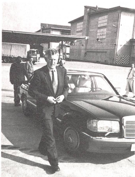
Bundesrat Kaspar Villiger eilte herbei und sprach mutige Worte gegen die Initiative der GSoA.

Hans Widmer , Präsident des Verwaltungsrates der Oerlikon-Bührle Holding AG, erwähnte in seiner Ansprache, dass das Vorhaben nicht ohne Schwierigkeiten und Probleme fristgemäss abgewickelt werden konnte. Es sei zu berücksichtigen, dass über Jahre hinweg – bei gleichbleibender Qualität – alle vier Arbeitstage ein Panzer hätte fertiggestellt werden müssen. Es sei aber ein grosser Erfolg, hinter dem sich eine bemerkenswerte Leistung verberge, seien doch rund 800 Unternehmen aus sämtlichen Landesteilen an diesem Projekt beteiligt gewesen, stellte Widmer fest.