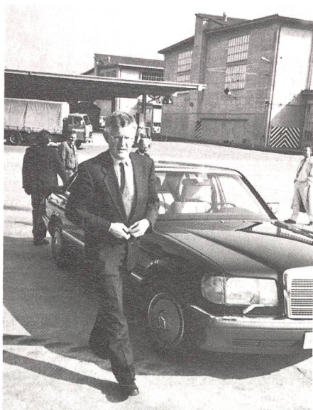
Bundesrat Kaspar Villiger eilte herbei und sprach mutige Worte gegen die Initiative der GSoA.

schneller, beweglicher und leistungsfähiger geworden sind.»