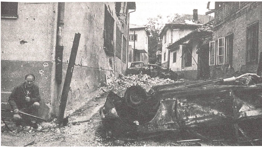
«Aus der Geschichte nichts gelernt – Sommer 92 Sarajewo – bald jeder noch Zurückgebliebene ist bewaffnet.»

trationslagern exemplarisch aufzeigt. Die Möglichkeiten zur Einmischung von Drittstaaten mit entsprechender Ausweitung der Konflikte sind heute wieder unendlich vielfältiger als zur Zeit des kalten Krieges. Lokale Machthaber in den ehemals sowjetischen Republiken stützen sich häufig einzig auf die Macht der Bajonette, welche sie kommandieren. Man nannte diese Sorte von Machthabern im Alten China « War Lords », in Südamerika « Commandantes ». Sie bescherten ihren Untertanen kaum mehr als Blut und Tränen.