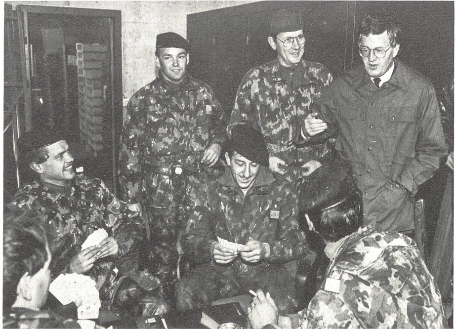
Kaspar Villiger im Manöver Dreizack im November 1989

Weil die Sicherheit der Schweiz von jener Europas abhängt, müssen wir mithelfen, dass dieses Europa sicherer wird: durch aussenpolitische Aktivitäten in der KSZE und im Eu-