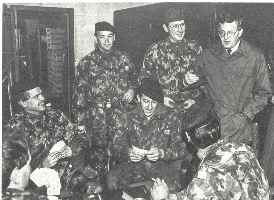
Kaspar Villiger im Manöver Dreizack im November 1989

Weil die Sicherheit der Schweiz von jener Europas abhängt, müssen wir mithelfen, dass dieses Europa sicherer wird: durch aussenpolitische Aktivitäten in der KSZE und im Eu-