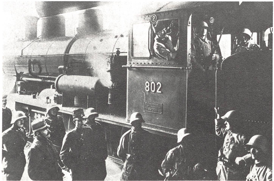
Die Armee sichert während des Generalstreiks die Aufrechterhaltung des Eisenbahnverkehrs

Im Spannungsfeld derart kontroverser Beurteilungen bewegt sich in der Schweiz die oft mehr oder weniger politisch motivierte Diskussion um die sogenannten Ordnungsdienststeinsätze der Armee bis heute. So argumentieren Gegner der Armee – etwa im Rahmen der Armeereform 1989 – immer wieder unter Beizug historischer Ordnungsdienststeinsätze gegen die Armee insgesamt und das gespaltene Verhältnis der Sozialdemokratie zur Landesverteidigung resultiert nicht zuletzt aus diesen Einsätzen.