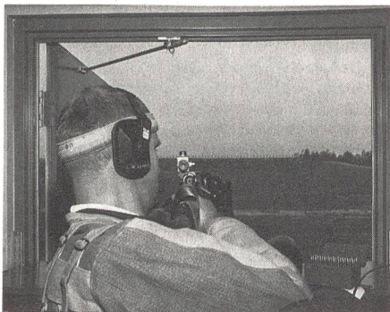
Höchste Konzentration – Eindruck aus dem Gewehr-Schiessstand.

Das anspruchsvollste Schiessprogramm ist zweifellos das CISM-Schnellfeuerprogramm. Hier klassierte sich die Schweizer Mannschaft auf dem 4. Schlussrang. Nach Ansicht ihres Trainers Heinz Bolliger hätten sie gut und gerne 10 Punkte mehr schiessen können, damit hätten ihnen allerdings immer noch 3 Punkte zur Bronze-Medaille gefehlt. Heinz Bolliger verglich das Schnellfeuerprogramm mit