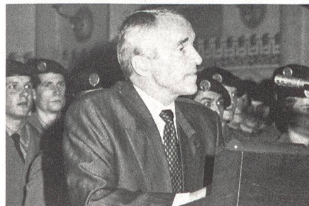
Nationalrat Werner Vetterli

Anschliessend beglückwünschte er alle jungen Offiziere zu den in den vergangenen 17 Wochen erbrachten Leistungen. Er unterstrich die Wichtigkeit einer gut funktionierenden Infrastruktur, sind doch alle hier ausgebildeten Offiziere entweder bei den Fliegerübermittlungs-, Fliegerboden- oder Fliegerabwehrtruppen eingeteilt und somit verantwortlich, dass nur so, zusammen mit einer starken Flugwaffe, der sicherheitspolitische Auftrag der Armee ausgeführt werden kann. Mit Bezug auf die im Armeeleitbild 95 festgehaltene «menschenorientierte Führung auf allen Stufen» rief er alle Anwesenden auf, sich für eine starke Armee, mit oder ohne europäische Sicherheitskonzeption, einzusetzen.