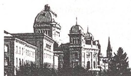
Das Bundeshaus in Bern

Das Tierschutzgesetz ist besser geworden. Neu ist seit letztem Jahr beim Tierversuch die verschärfte Bewilligungspraxis und die Überwachung durch das Veterinäramt des Bundes. Damit wurde eine effiziente Kontrolle noch griffiger gemacht. Trotzdem ist wieder eine Initiative «zur Abschaffung der Tierversuche» eingereicht worden. Diese Initiative hätte für Forschung und Medizin schlimme Folgen. «Die medizinische Versorgung des Menschen und der Tiere würde schlechter», schreibt der Bundesrat in seiner Botschaft dazu.