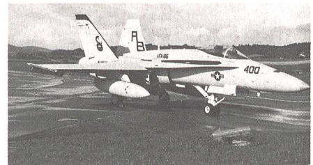
Die F/A-18-Flugzeuge der US-Navy stiessen bei den Besuchern auf sehr grosses Interesse.

Vor 25 Jahren sind die drei Brigaden der Flieger- und Fliegerabwehrtruppen ins Leben gerufen worden. Welche Leistungen diese neustrukturierte Waffengattung zu vollbringen imstande ist, hatten am