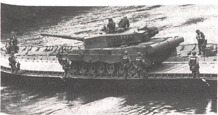
Premiere während dem «Genierapport 1993»: Erstmals befuhr ein zirka 60 Tonnen schwerer Kampfpanzer Leopard die erste durch Schweizer Genisten in ganzer Länge über einen Fluss gebaute Schwimmbrücke 95.

Mit den armee-eigenen Baumaschinen wird einerseits die Baumaschinenführer- und Truppenhandwerker-Ausbildung in den Rekrutenschulen sichergestellt. Andererseits wird mit ihnen der Grundbedarf an Baumaschinen im WK abgedeckt, sofern sie nicht in den Schulen benötigt werden. In diesem Jahr wurde ein neues Baumaschinen-Beschaffungs- und -Unterhaltskonzept erarbeitet. Als Pilotprojekt dient die zur Beschaffung anstehende neue Raupenladeschaukel. Im Oktober 1993 wurden zwei Typen einer kurzen Truppenerprobung unterzogen.