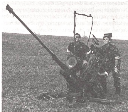
L Flab beim Richten mit Florett (AMEF-Flab 92).