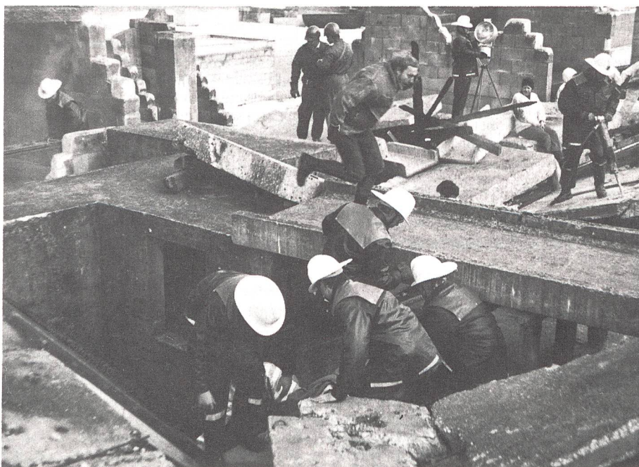
Rettungsspieler des Zivilschutzes mit neuer Schutzkleidung im Einsatz auf einem Schadenplatz.

Mit der Neuausrichtung gemäss neuem Leitbild hat der Zivilschutz neben dem Schutz der Bevölkerung vor den Auswirkungen kriegerischer Ereignisse schwergewichtig einen wesentlichen Beitrag zur Hilfeleistung bei natur- und zivilisationsbedingten Katastrophen und in anderen Notlagen zu erbringen. Zudem soll