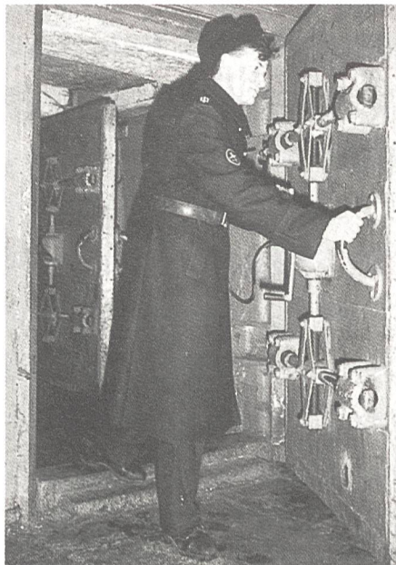
Ein besonders gesicherter Eingang zur unterirdischen strategischen Kommandozentrale des Kernwaffenstützpunkts Nerpischje in Russland.

Eine Schwalbe macht noch keinen Sommer, und über Befragungen kann man in guten Treuen verschiedener Meinung sein. Aber offenbar dämmert es doch manchem Schweizer und mancher Schweizerin allmählich, dass