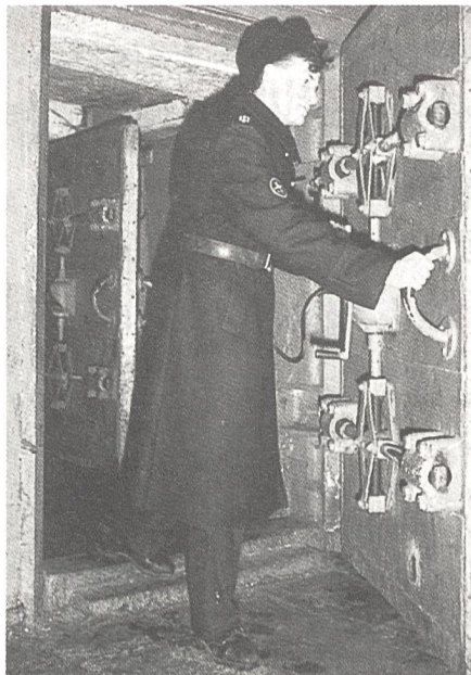
Ein besonders gesicherter Eingang zur unterirdischen strategischen Kommandozentrale des Kernwaffenstützpunkts Nerpischje in Russland.

Forschungsstelle. Diese Befragung wurde im November und Dezember 1992 bei rund 1000 stimmfähigen Schweizerinnen und Schweizern aus allen drei Landesteilen durchgeführt. Das Interesse an der Sicherheitspolitik wurde am Beispiel der beiden wehrpolitischen Initiativen mit Abstimmung am 6. Juni 1993 untersucht. Zunehmendes Interesse an der Sicherheitspolitik, auch der Frauen, wieder steigende Akzeptanz der Schweizer Armee und eine deutlich pessimistischere Wahrnehmung von Bedrohung und Weltlage: Dies sind die generellen Schlussfolgerungen aus dieser wissenschaftlichen Befragung. Nur eine knappe Mehrheit der Befragten (57%) vertritt die Meinung, der Anteil der Militärausgaben sei zu hoch; 1990 waren es noch 71 Prozent. Es scheint, als würden mindestens die drastischen Sparanstrengungen des Eidgenössischen Militärdepartementes zur Kenntnis genommen. Eine Schwalbe macht noch keinen Sommer, und über Befragungen kann man in guten Treuen verschiedener Meinung sein. Aber offenbar dämmert es doch manchem Schweizer und mancher Schweizerin allmählich, dass