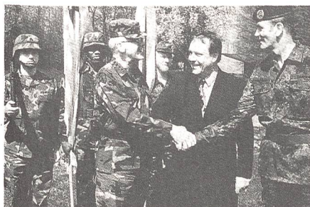
Gemeinsamkeit besiegeln der US-General David M Maddox, Minister Volker Rühle und Generalleutnant Helge Hansen.

nale Streitkräftestrukturen sind Ausdruck für die revolutionären sicherheitspolitischen Veränderungen».