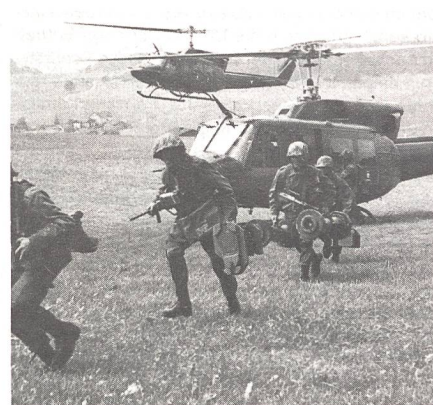
Mittels Hubschrauber gelandete Jägergruppe mit Panzerabwehrwaffen Bill.

Ein Konflikt zwischen den Staaten «Orange» und «Grün» lag der Übungsannahme zugrunde. Er eskalierte und griff zum Teil am Boden und in der Luft auf den Nachbarstaat «Blau» über. Dessen Verteidiger, dargestellt von den Militärakademie-Schülern samt den von ihnen geführten Truppen, hatten das zu verhindern. Bewaffnete Verbände von «Grün» und «Orange» versuchten auf das Staatsgebiet von «Blau» vorzudringen. Sie versuchten das fremde Territorium zu benützen, um dem Feind in die Flanke zu stossen und teilweise auch, um «Blau» zu provozieren. Gleichzeitig trat eine grosse Anzahl ziviler