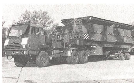
Die Fahrzeuge der «Schwimmbrücke 95» wurden helvetisiert. Die Brückenmodule (und deren Tarnbemalung) entsprechen dem original «Pont flottant motorisé» der französischen Armee.

Die vor 32 Jahren angeschaffte 50-Tonnen-Schlauchbootbrücke unserer Genietruppen ist komplett überaltert. Sowohl betreffs Einbauzeit wie auch bezüglich ihrer Tragfähigkeit entspricht sie den heutigen Erfordernissen nicht mehr. Nach erfolgter Evaluation verschiedener Fabrikate entschied man sich im EMD, die Anschaffung des «Pont flottant motorisé» (PFM) in Betracht zu ziehen, der zum Modernsten und Besten gehört, was es in diesem Bereich auf