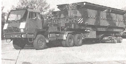
Die Fahrzeuge der «Schwimmbrücke 95» wurden helvetisiert. Die Brückenmodule (und deren Tarnbemalung) entsprechen dem original «Pont flottant motorisé» der französischen Armee.

Die vor 32 Jahren angeschaffte 50-Tonnen-Schlauchbootbrücke unserer Genietruppen ist komplett überaltert. Sowohl betreffs Einbauzeit wie auch bezüglich ihrer Tragfähigkeit entspricht sie den heutigen Erfordernissen nicht mehr. Nach erfolgter Evaluation verschiedener Fabrikkate entschied man sich im EMD, die Anschaffung des «Pont flottant motorisé» (PFM) in Betracht zu ziehen, der zum Modernsten und Besten gehört, was es in diesem Bereich auf