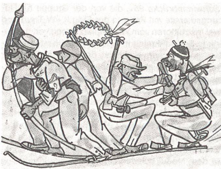
Die Tösstaler Siegerpatrouille an den Weissen SUT 1958 in Entlebuch.

Der UOV Tösstal kann dieses Jahr sein 50jähriges Bestehen feiern. Aus der umfangreichen, informativen und gutbebilderten Jubiläumsschrift stammen die beiden folgenden Karikaturen von Hans Frey.