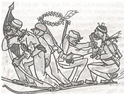
Die Tösstaler Siegerpatrouille an den Weissen SUT 1958 in Entlebuch.

Der UOV Tösstal kann dieses Jahr sein 50jähriges Bestehen feiern. Aus der umfangreichen, informativen und gutbebilderten Jubiläumsschrift stammen die beiden folgenden Karikaturen von Hans Frey.