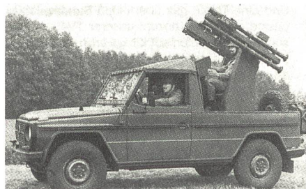
Aus Soldat und Technik 5/1993

soll die Krisenreaktionskräfte vor Angriffen aus der Luft schützen. Der Waffenträger, auf dem ein Abschussgestell für vier STINGER montiert sein wird, soll in einer CH-53 Luftverladbar sein. Ob dafür besser ein Radfahrzeug oder ein Kettenfahrzeug geeignet erscheint, wird bis zur Billigung einer Taktisch-technischen Forderung (TTF) abschliessend bewertet. Je fünf Waffenträger bilden mit einer Aufklärungs- und Feuerleiteinheit einen autonomen Zug. Drei Züge werden in einer Batterie mit Verbindungsgruppen