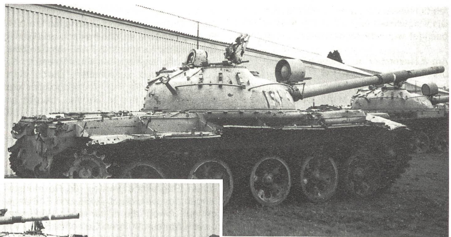
Zur Ausrüstung der Streitkräfte Saddam Husseins gehörten auch Kampfpanzer des ehemals sowjetischen Typs T-62.