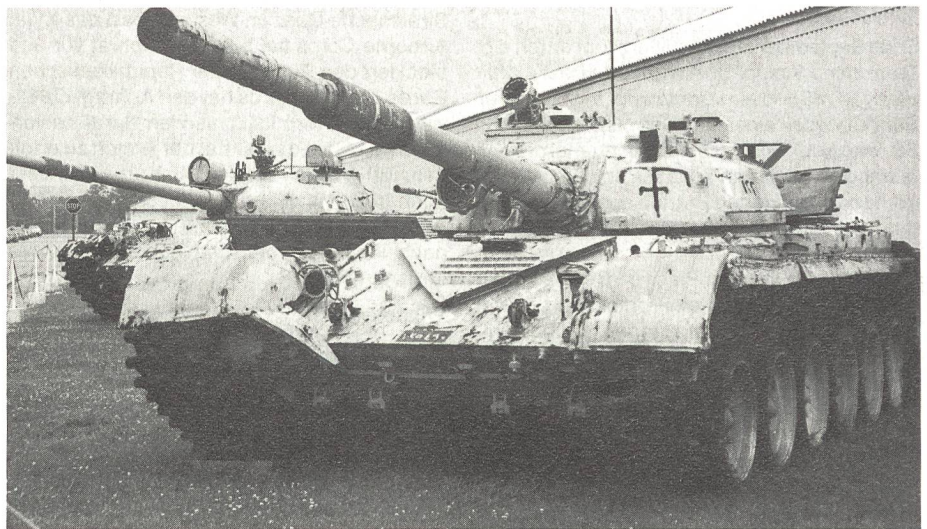
Zum modernsten Kriegsmaterial der Irakis gehörte zweifellos dieser Kampfpanzer. Es handelt sich um den Kampfpanzer des ebenfalls sowjetischen Typs T-72, mit welchem vor allem die Eliteformationen der Republikanischen Garde ausgerüstet waren. Seitlich am Turm sind einige arabische Schriftzüge zu erkennen.

50 Kilometer südlich der amerikanischen Hauptstadt Washington findet man auf der Autobahn Nr 95 einen Hinweis auf den Stützpunkt des US-Marinekorps Quantico. Am Eingang zum Marinestützpunkt lassen die Sicherheitskräfte Besucher nach Vorzeigen eines Ausweises ohne weiteres passieren, wenn sie den Wunsch zur Besichtigung des Museums äussern. Dieses befindet sich mitten im riesigen Komplex und umfasst einige Hallen unweit des Exerzierfeldes für angehende Offiziere (« Officer Candidate School »). Während in den Hallen in chronologischer Reihenfolge die vielfältige Geschichte der Marineinfanterie mit ihren zahlreichen und ruhmreichen Gefechten in der Karibik, in Europa, im Pazifik, in Korea und in Vietnam eindrücklich dargestellt wird, ist auch bereits ein kleiner Teil den Aktivitäten im Golfkrieg gewidmet. Im Freien sind zudem schon einige sehenswerte Beutestücke des irakischen Heeres ausgestellt. Teil der Ausstellung ist auch ein amerikanischer Kampfpanzer des Typs M-60 A3, der vom Marinekorps im Golfkrieg 1991 eingesetzt wurde. Zu den irakischen Gegenständen gehören Kampfpanzer des ehemals sowjetischen Typs T-72, T-62 und T-55 sowie ein Kampfschützenpanzer des Typs BMP-1.