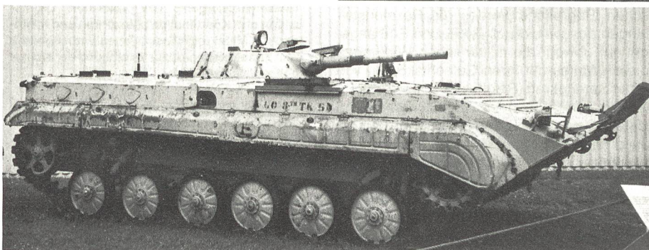
Kampfschützenpanzer des ehemals sowjetischen Typs BMP-1. Er ist mit einer 73-mm-Glattrohrkanone bestückt.