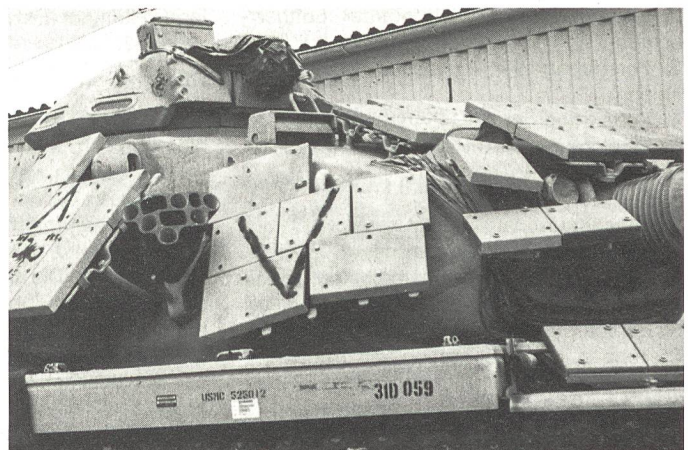
Ein Kampfpanzer des amerikanischen Typs M-60 A3, wie er von Teilen der 1. und 2. Marineinfanteriedivision eingesetzt wurde. Diese beiden Verbände waren aus Süden zwischen den zwei arabischen Korps auf Kuwait gestossen. Der Turm ist mit zusätzlichen Stahlplatten versehen, um Hohlladungsgeschosse vorzeitig zur Explosion zu bringen.