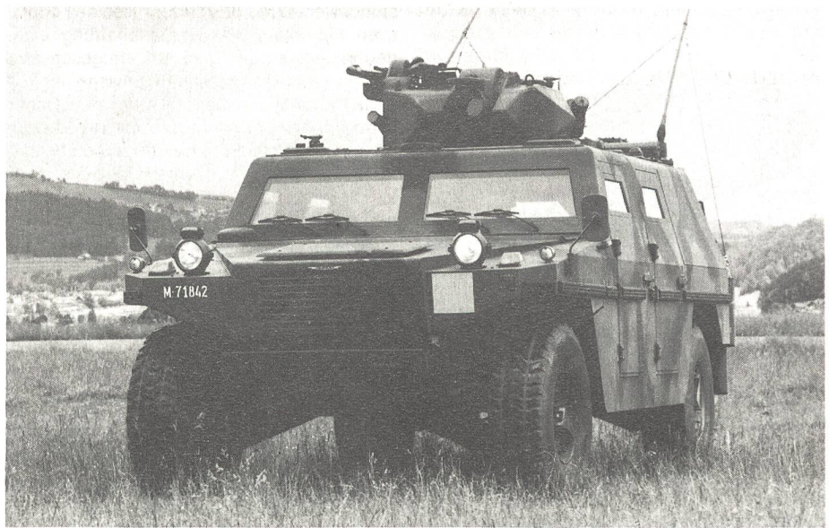
Leichtgepanzertes «Mowag»-Aufklärungsfahrzeug. Höchstgeschwindigkeit 105 km/h, Dieselmotortyp 6,2 Liter, 150 PS.

Die männlichen AdA sollen mit der neuen Ausgangsbekleidung 95 ausgerüstet werden. Mit dem vorliegenden Beschaffungsantrag