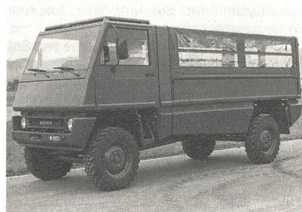
Der Militärlieferwagen 2 t «DURO», 4x4 geländegängig, 4-Gang-Automat. 6 Zyl, VM-Diesel, 110 kW bei 4200 U/min.

Infolge der anfallenden grossen Unterhaltskosten bei vielen seit 20 bis 30 Jahren im Dienst stehenden Motorfahrzeugen muss der Park erneuert werden. Mit dem Ziel der dringendsten Rationalisierung sollen im RP 93