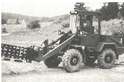
Feldumschlaggerät für die Pz Art Abt, Pz- und Mech Bat sowie für die Sch Mw Kp.

Mit der beantragten Beschaffung von 300 Feldumschlaggeräten soll allen Pz Art Abt, Pz und Mech Bat sowie allen Sch Mw Kp der Inf ein Güterumschlagmittel gebracht werden. Diesen Truppen fehlten bisher am Einsatzort weitgehend geländegängige Geräte für den Auf- und Ablad palettierter und schwerer Gü-