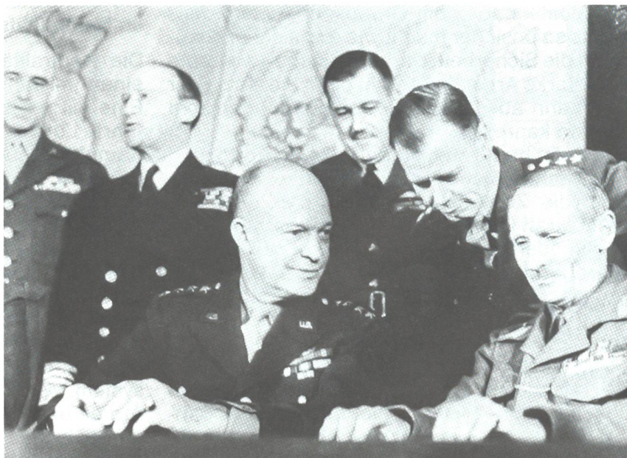
General Eisenhower bei der Planung der Invasion Frankreichs mit (von links nach rechts) General Omar Bradley, Kommandant der 1. US-Armee; Admiral Sir Bertram Ramsay, Oberbefehlshaber der alliierten Seestreitkräfte; Luftmarschall Sir Leigh Mallory, Oberbefehlshaber der alliierten Luftstreitkräfte; Eisenhowers Stabschef General Walter Bedell Smith und Feldmarschall Sir Bernard Montgomery, Kommandant der 21. Heeresgruppe.

Seine Taten unterstützen dieses Paradox. War er am 5. Juni 1944 in der Lage, eine der wichtigsten Entscheidungen (Invasion in Frankreich) während des ganzen Zweiten Weltkrieges zu fällen, konnte er sich am nächsten Morgen nicht entscheiden, welche Uniform er anziehen wolle. Als siegreicher General wurde er zum Kreuzfahrer für den Frieden. Er beendete den Koreakrieg und schuf die Grundlagen für den Krieg in Vietnam. Er nahm eine harte Linie gegen den Kommunismus, wurde aber von Chruschtschow nach dessen Besuch als weich bezeichnet. Er hatte Angst