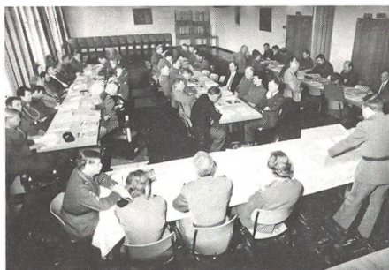
Die Präsidentenkonferenz im Kirchgemeindehaus Brienz.

Nationalrat Paul Fäh , Leiter der Koordinationsstelle für Gesamtverteidigung des Kantons Luzern und Stabschef der kantonalen Notstandsführung orientierte in einem praxisnahen Vortrag über die Arbeit und Erfahrungen in seinem Verantwortungsbereich.