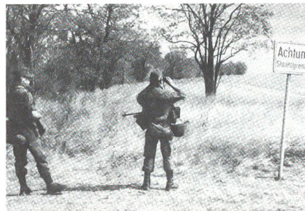
Aus «Soldat» Österreich, Nr 21, Nov 91, gekürzt.

Das Innenministerium ragierte mit seinem Ansuchen auf eine Steigerung der illegalen Grenzübertritte im