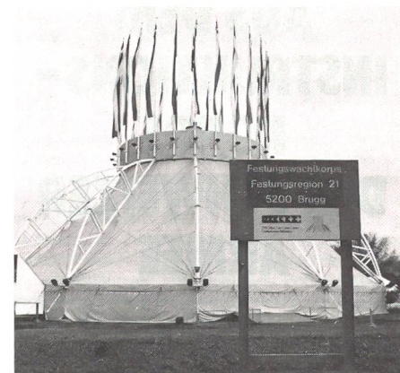
Botta-Zelt auf dem Bäumlhofareal in Basel.

erfolgten Räumung eines besetzten Areals ausgesprochen. So musste die Polizei bereit sein, es kam jedoch anders. Nicht die Basler Kulturgeländebesetzer erschienen, um die Abschlussfeier zu stören, sondern rund 50 Béliers. Die Separatisten aus dem Jura fing eine Schlägerei an. Ein Basler Polizeibeamter musste mit einem Kopfschwarzenriss, welcher von