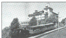
Das Sonnenverwöhnte: Heidi's Bellevue