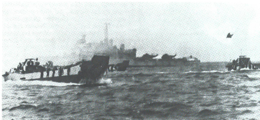
Am 21. Mai 1982 stürmten britische Soldaten von mehreren Booten aus bei Port San Carlos auf der Ostinsel an Land.

Während die britischen Minister und Politiker der argentinischen Aktion fassungslos gegenüberstanden, überzeugte der Erste Sea Lord, Admiral Sir Henry Leach, die Premierministerin Margaret Thatcher von der Möglichkeit einer erfolgreichen Rückeroberung durch die Royal Navy. Was den Kampfgruppenkommandanten betraf, so fiel die Wahl auf den jungen Konteradmiral Sandy Woodward. Dieser war am 7. Juli 1981 befördert und anschliessend zum Flaggoffizier der Ersten