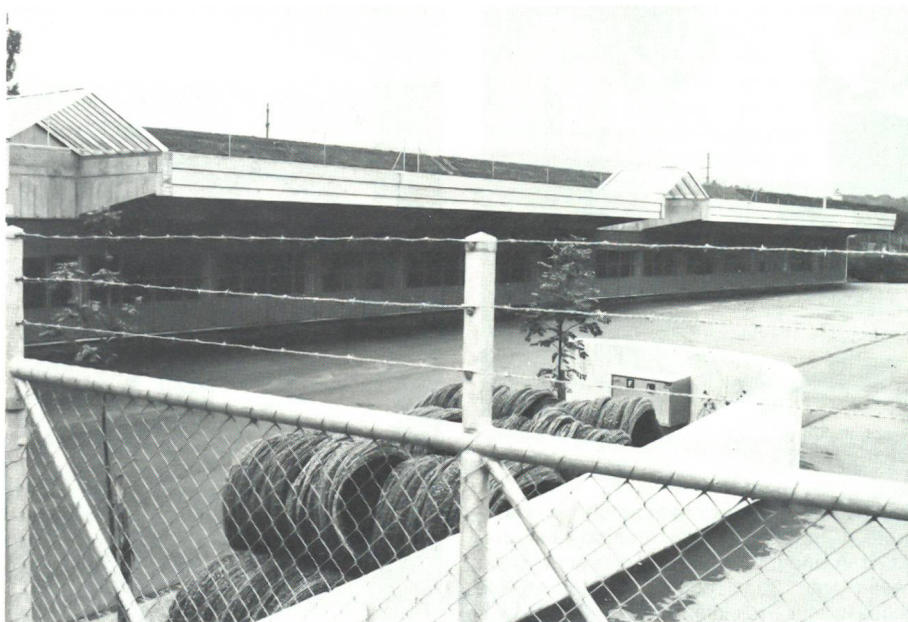
Das erste Zeughaus unter einer Autobahn wurde bei Müllheim gebaut.