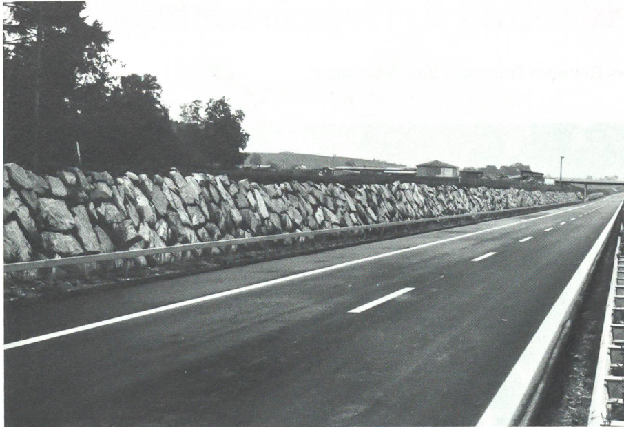
Panzerhindernisböschungen verhindern das Ausbrechen eines Gegners ins Gelände.

der Stahlspinnen eingebaut worden, am Rand neben dem Pannestreifen lagert das komplette technische Material.