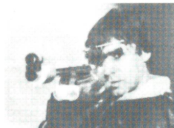
Pierre A. Dufaux Mehrfacher Weltmeister, Europameister, Schweizer Meister