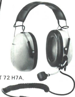
MT 72 H7A.

auch lieferbar mit Nackenbügel oder Helm- befestigung