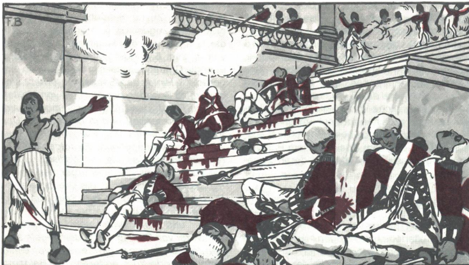
Kampf im Treppenhaus des Tuilerienpalastes. Die letzten Kompanien des am 10. August 1792 gegen Mittag bereits zerschlagenen Garderegiments gehen unter.

Erinnerungspostkarte zum 1. August um 1920