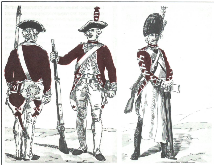
Füsilier (links) und Kanonier (Mitte) sowie rechts Sappeur des Schweizer Garderegiments (Ansichtskarten um 1920).

Vielleicht wäre es unmittelbar nach der wenig glorreichen Einnahme des praktisch leeren Staatsgefängnisses (später zum Nationalfeiertag erhoben), das von einer Invalidenkompanie sowie 32 Füsiliern, einem Wachmeister und einem Leutnant aus dem Schweizer Regiment Salis-Samaden verteidigt worden war, noch gelungen, die Lage unter geballtem Einsatz der halbwegs loyalen