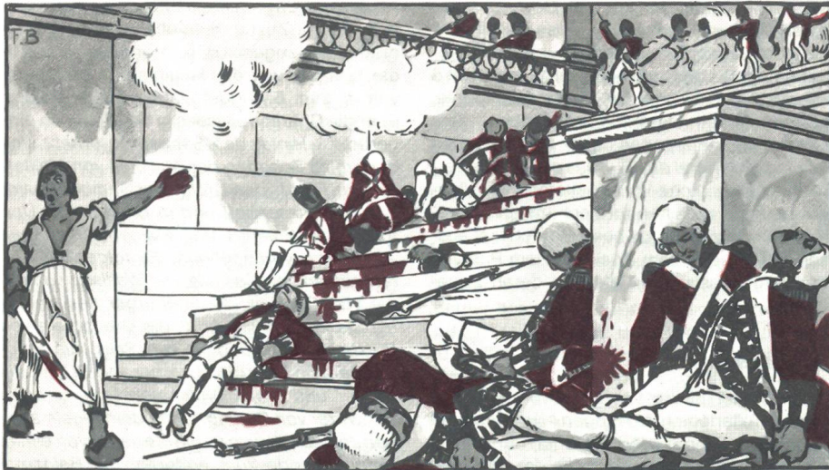
Kampf im Treppenhaus des Tuilerienpalastes. Die letzten Kompanien des am 10. August 1792 gegen Mittag bereits zerschlagenen Garderegiments gehen unter.

Erinnerungspostkarte zum 1. August um 1920