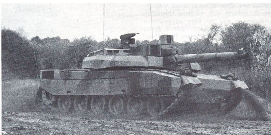
Der Kampfpanzer «Leclerc» legt aus dem Stand 400 m innerhalb 30 Sekunden zurück. Seine Höchstgeschwindigkeit beträgt 71 km/h.

Das französische Rüstungsamt schliesst die Möglichkeit von Exporten des Panzers «Leclerc» nicht aus. Dazu seien 1990 Kontakte mit Grossbritannien und Saudiarabien aufgenommen worden. Die Briten sollten bis Ende 1990 den Entscheid über die Nachfolge des jetzigen «Challengers» bekanntgeben. Im engeren Wettbewerb stehen dabei der deutsche «Leopard 2», der amerikanische «M1 Abrams», der britische «Challenger 2» sowie der französische «Leclerc». Nur der «Leclerc» soll ein Vertreter der dritten Generation sein. (Deutsche Übersetzung durch Cedocar P Callé, angepasst durch Redaktion «Schweizer Soldat», Copyright durch franz Mil Zeitung «Armées d'Aujourd'hui», Nr 152)