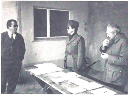
Regierungsrat Hofmann (links) lässt sich die Startformalitäten erklären.