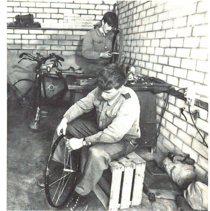
Arbeit in der Radwerkstatt

Lastenträger für das Maschinengewehr, die Maschinengewehrlafette, das Raketenrohr oder die Munition