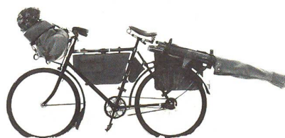
Schwer und robust: das beliebte Ordonnanzrad 05 mit aufgeschalltem Raketenrohr

Das heutige Ordonnanzrad (nur Banausen sprechen vom «Velo»)