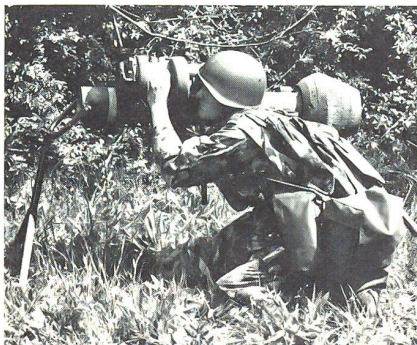
Der Dragon bildet die Hauptpanzerabwehrwaffe der Radfahrer

dentlich viele Spitzensportler (in der Rdf RS 226/90 rund 50!) und insbesondere zahlreiche Radrennsportler. Entsprechend positiv ist die Motivation und Leistungsbereitschaft der jungen Rekruten.