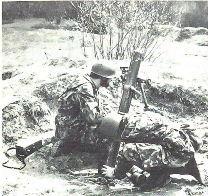
Die Ausbildung am 8,1-cm-Minenwerfer erfolgt ebenfalls in der Radfahrerschule