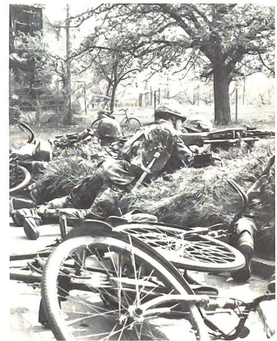
Rascher Übergang in das Gefecht: die Mitrailleurguppe in Feuerstellung

Da in den erwähnten Gefechtsaufgaben der Regimentseinsatz kaum mehr die Re-