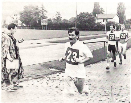
Unterwegs im strömenden Regen auf dem 12-Minuten-Lauf.