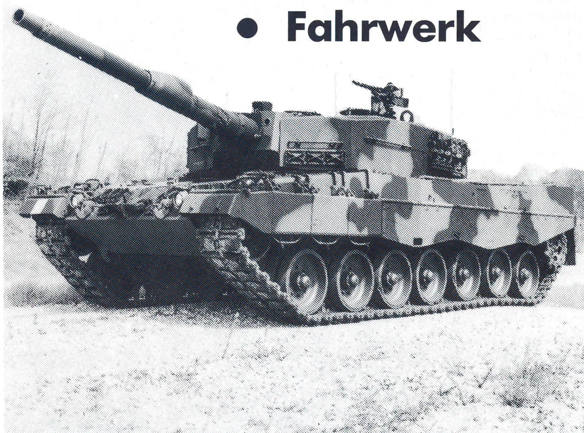
Pz. 87 Leopard 2