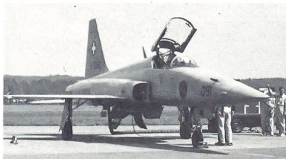
Tiger auf der Rampe bereitgestellt.

Dieser war verbindendes Element für alle Wettkämpfer. Es handelt sich dabei um einen sportlichen Wettkampf, bei dem in den Diszi-