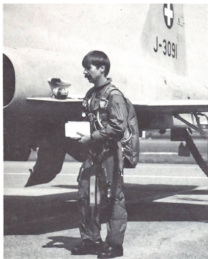
Höchste Konzentration. Tiger-Pilot bei den Vorbereitungen zum Kriegsflug.

So heissen die ehemaligen Fallschirmgrenadiere heute. Sie sind ein Aufklärungsmittel der Armee und sind dazu ausgebildet, passive Nachrichtenbeschaffung hinter den feindlichen Linien zu betreiben. Der Fernspäher ist dabei oft physisch und psychisch grössten Belastungen ausgesetzt. Er muss in der Lage